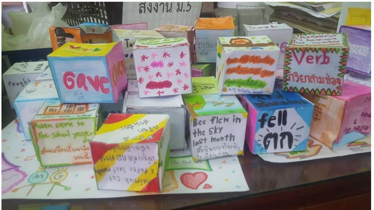
ภาพประกอบ(3)