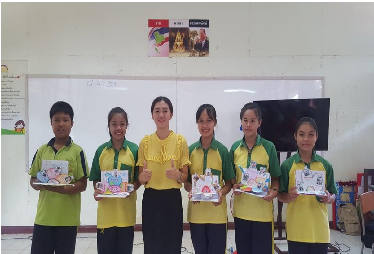
ภาพประกอบ (1)